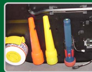
Montaje en tapa maletero vehículo