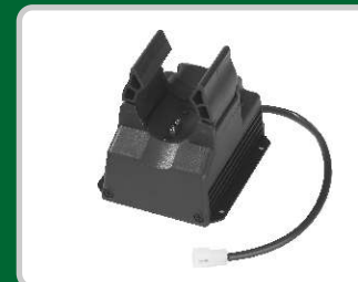
CL510, Cargador de linterna, carga normal