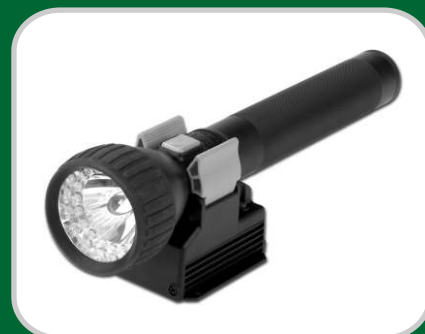
Linterna y cargador Serie L500, Versión de LEDs, carga rápida

Dos modelos de cargadores de linterna, en carga normal (30 horas de tiempo de carga) o carga rápida (2 horas y 30 minutos de tiempo de carga). El modelo de carga rápida dispone de desconexión automática que impide la sobrecarga de la linterna.