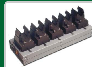
CM510, Cargador múltiple de (5) linternas Serie L500