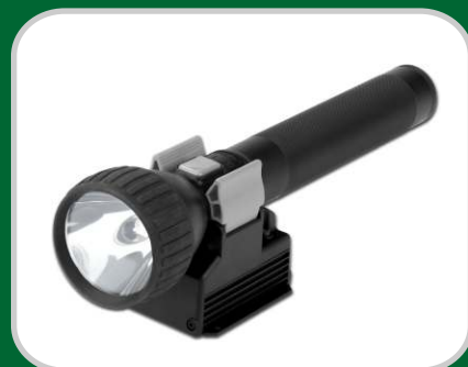
Linterna y cargador Serie L500, Versión Intermitencia, carga rápida