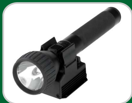
Linterna y cargador Serie L500, Versión Estándar, carga normal