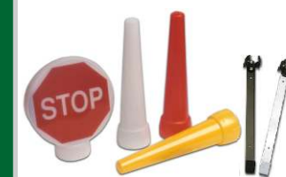
Gama accesorios Serie L500