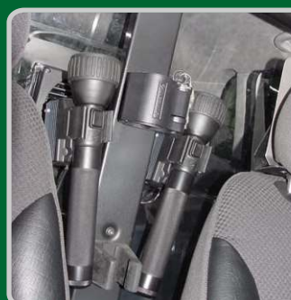
Montaje en mampara vehículo (Kit transporte detenidos)