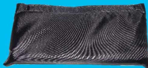
Bolsa para almacenar cómodamente el parasol incluida.