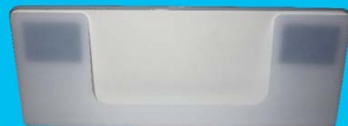
Solapas para su colocación en el parasol del vehículo.

No requiere de soportes fijos ni adhesivos, y puede o quitarse o plegarse cuando su uso no es necesario. Incorpora conectores que permiten guardar todo el cableado de manera ordenada, desconectando el parasol cuando éste no se use durante un periodo prolongado de tiempo.