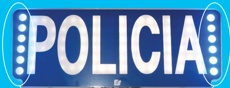
Luces azules de emergencia de alta visibilidad